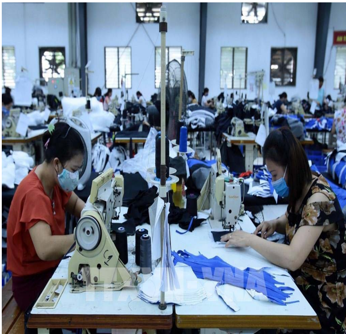
Hình ảnh số 04: Sản xuất sản phẩm may mặc tại Công ty TNHH may Kydo (Khu Công nghiệp Phố nổi A, tỉnh Hưng Yên)

Nguồn: Mai Ngoan (2020), Hưng Yên coi trọng nông nghiệp công nghệ cao , https://bnews.vn/hung-yen-coi-trong-nong-nghiep-cong-nghe-cao/175657.html#modal-media-image-160642 , [truy cập ngày 15/12/2025].