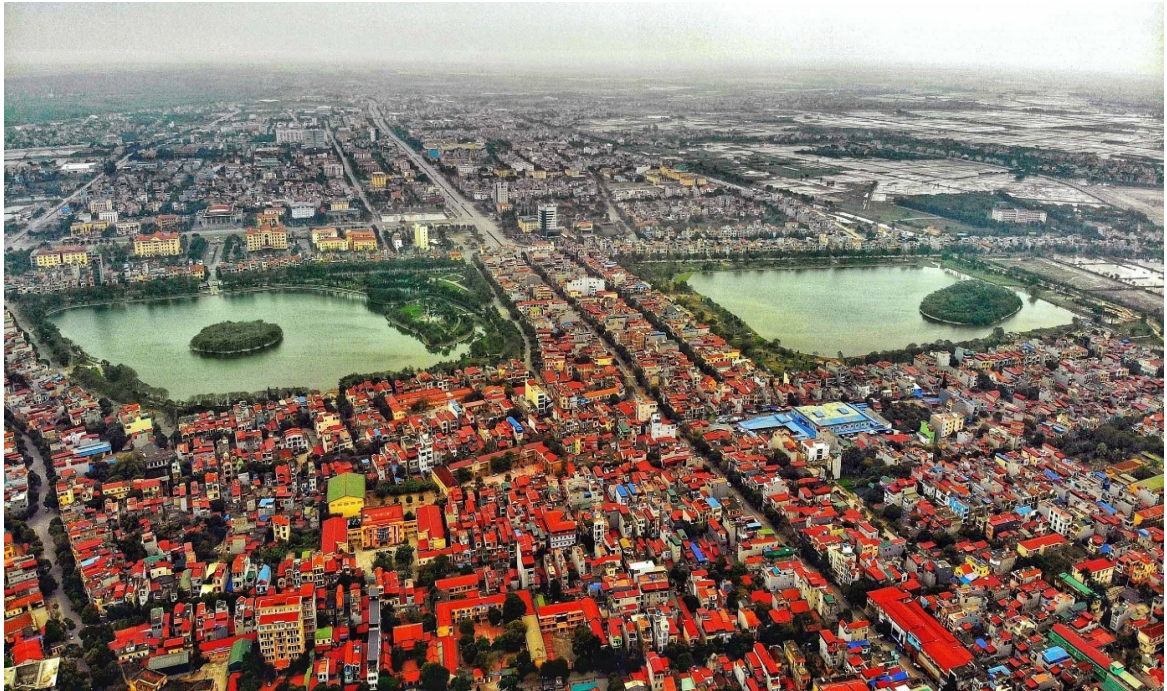
Hình ảnh số 06: Diện mạo đô thị thành phố Hưng Yên năm 2020