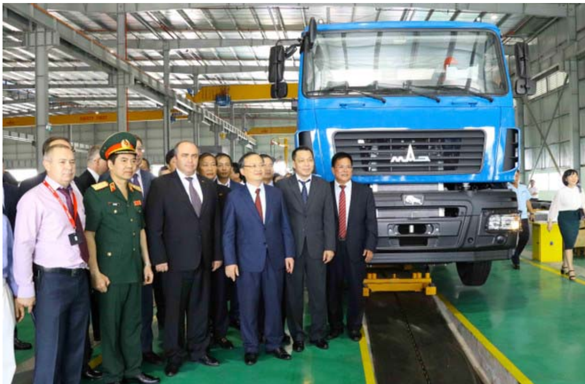
Hình ảnh số 05: Các đại biểu đi thăm quy trình sản xuất ô tô trong Nhà máy Sản xuất và lắp ráp ô tô MAZ ASIA tại xã Chính Nghĩa, huyện Kim Động, tỉnh Hưng Yên